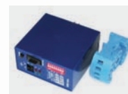
P11001 00003 – RMM 2 Двухканальные металлодетекторы. 230 В