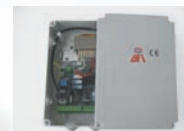
D113653 00002 – PERSEO N См. стр. 98