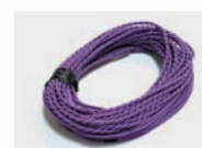
D110926 00001 – SPIRA 2X1 Магнитная веревка 2x1 м.