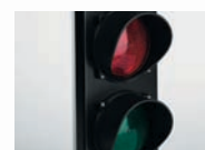
D121458 – PARKY LIGHT Светофор.