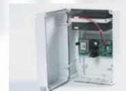
P975001 – STOPPY BAT Набор резервных батарей, обеспечивающий подъем столба даже в случае сбоя питания